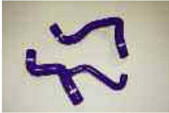
Ford FOCUS 2.0 ZETEC VE1071663 1998 > 2004 Tipo di Tubo: Coolant Numero di Tubi: 2 euro 164,70