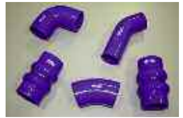
Ford FOCUS 1.8 TD DI VE1081203 1998 > 2000 Tipo di Tubo: Turbo Numero di Tubi: 5 euro 200,60