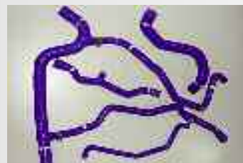
Renault CLIO 2 172/182CV VE1051277 1999 > 2005 Tipo di Tubo: Coolant Numero di Tubi: 4 euro 345,40