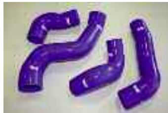
Audi A4 B7 2.0 TURBO VE1090266 2005 > 2007 Tipo di Tubo: Intercooler Numero di Tubi: 4 euro 241,40