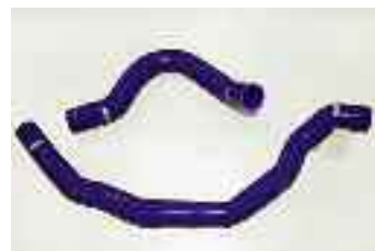
Volvo V70N 2.4L TURBO VE1081139 2001 > Present Tipo di Tubo: Coolant Numero di Tubi: 2 euro 111,60