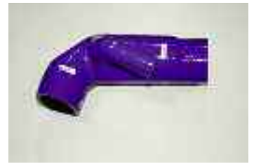
Seat CORDOBA GTI 16V VE1081285 1996 > 1999 Tipo di Tubo: Induction Numero di Tubi: 1 euro 119,50