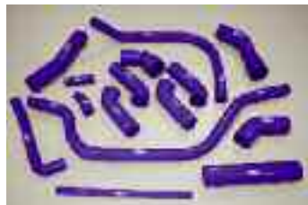
Ferrari F430 Challenge VE1090148 2005 > Present Tipo di Tubo: Coolant Numero di Tubi: 15 euro 763,60