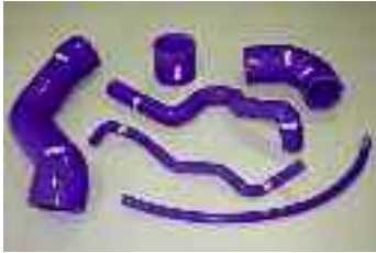
Audi TT 1.8T 20V 150CV VE1100095 2001 > 2006 Tipo di Tubo: Turbo Numero di Tubi: 6 euro 210,00