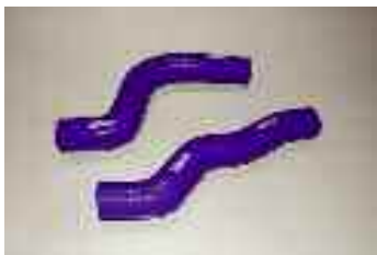
Lancia DELTA INTEGRALE 16V VE1100215 1989 > 1994 Tipo di Tubo: Coolant Numero di Tubi: 2 euro 79,40