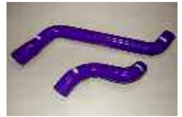
Opel VECTRA A/CAVALIERT 16V TURBO VE1040526 1992 > 1993 Tipo di Tubo: Coolant Numero di Tubi: 2 euro 105,20