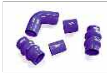
Ford FOCUS 1.8 TDCI VE1080741 2001 > Present Tipo di Tubo: Turbo Numero di Tubi: 5 euro 172,00