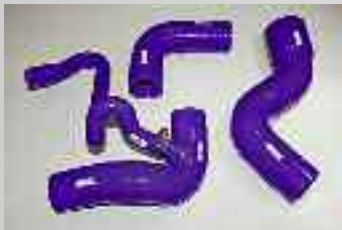
Volkswagen PASSAT 1.8TURBO TYPE 3B VE1040457 1996 > 2005 Tipo di Tubo: Turbo Numero di Tubi: 4 euro 215,80