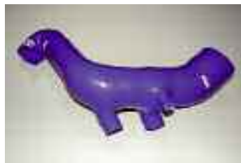
Audi A3 1.8T 20V VE1050017 2000 > 2003 Tipo di Tubo: Induction Numero di Tubi: 1 euro 197,80