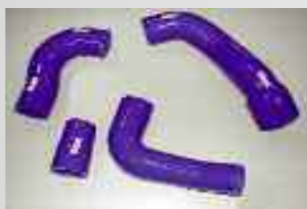
Fiat PUNTO GT TURBO 1.4 VE1040487 1993 > 1999 Tipo di Tubo: Turbo Numero di Tubi: 4 euro 177,20