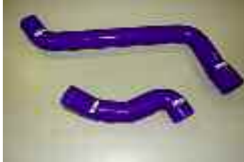
Opel VECTRA A/CAVALIERT 16V TURBO VE1040539 1992 > 1995 Tipo di Tubo: Coolant Numero di Tubi: 2 euro 104,30