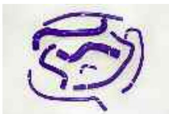
Corvette C-5 5.7 LTR. 350 INCH. VE1071061 2001 > 2004 Tipo di Tubo: Coolant Numero di Tubi: 8 euro 386,40