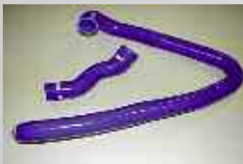
Nissan 300 ZX BITURBO VE1060380 1989 > 2000 Tipo di Tubo: Coolant Numero di Tubi: 2 euro 222,30