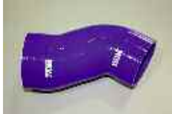
Subaru IMPREZA 2.0 WRX/GT VE1090288 1997 > 1998 Tipo di Tubo: Airbox hose Numero di Tubi: 1 euro 83,40