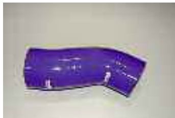
Subaru IMPREZA VE1050900 - Tipo di Tubo: Airbox hose Numero di Tubi: 1 euro 85,30