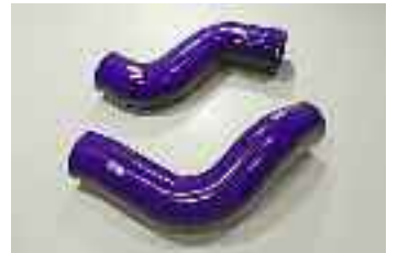
Seat LEON 1 CUPRA-R 1.8T 20V VE1040172 2002 > 2005 Tipo di Tubo: Intercooler Numero di Tubi: 2 euro 217,80