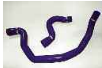
Volvo 850 TURBO/T5 VE1081136 1994 > 1997 Tipo di Tubo: Coolant Numero di Tubi: 2 euro 110,80