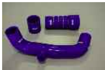
Audi COUPE S2 5 CYL. 20V TURBO VE1090525 1990 > 1992 Tipo di Tubo: Turbo Numero di Tubi: 3 euro 201,30