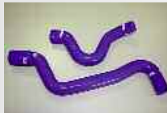
Renault 5 GT TURBO PHASE 1 VE1090639 1985 > 1986 Tipo di Tubo: Radiator Numero di Tubi: 2 euro 209,10