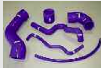
Volkswagen GOLF MK4 1.8T 20V VE1100095 1997 > 2006 Tipo di Tubo: Turbo Numero di Tubi: 6 euro 210,00