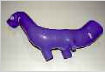
Volkswagen JETTA/BORA MK4 1.8T 20V VE1050017 2002 > 2005 Tipo di Tubo: Induction Numero di Tubi: 1 euro 197,80