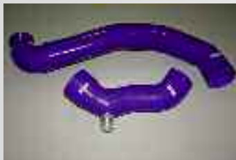
Renault 5 GT TURBO PHASE 1 e 2 VE1040595 1985 > 1991 Tipo di Tubo: Turbo Numero di Tubi: 2 euro 207,40