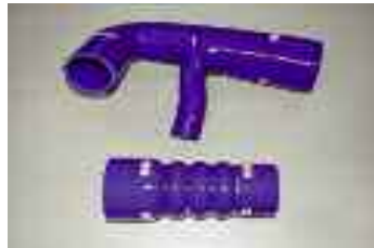
Audi QUATTRO 20V 200 TURBO VE1040448 1989 > 1991 Tipo di Tubo: Turbo Numero di Tubi: 2 euro 183,50