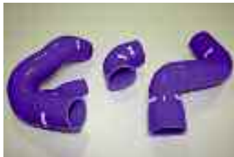
Audi A4 B6 1.8 TURBO VE1080188 2001 > 2003 Tipo di Tubo: Turbo Numero di Tubi: 3 euro 228,00