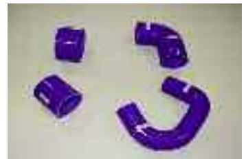
Subaru IMPREZA 2.0 STI VE1051092 1999 > 2000 Tipo di Tubo: Turbo Numero di Tubi: 4 euro 95,00