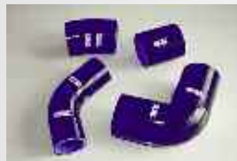
Nissan PATROL GR 3.0L TD VE1100789 1997 > 2009 Tipo di Tubo: Turbo Numero di Tubi: 4 euro 183,30