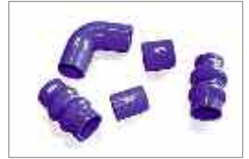
Ford MONDEO 1.8 TDCI VE1080741 2000 > Present Tipo di Tubo: Turbo Numero di Tubi: 5 euro 172,00