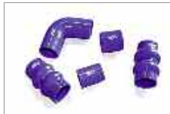
Ford S-MAX 1.8 TDCI VE1080741 2006 > Present Tipo di Tubo: Turbo Numero di Tubi: 5 euro 172,00