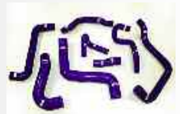
Volkswagen GOLF MK2 GTI 1.8 8V VE1040796 1987 > 1991 Tipo di Tubo: Coolant Numero di Tubi: 8 euro 208,60