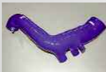
Volkswagen GOLF MK4 1.8T 20V VE1060038 1997 > 2006 Tipo di Tubo: Induction Numero di Tubi: 1 euro 194,10