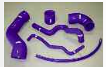
Volkswagen JETTA/BORA MK4 1.8T 20V 150CV VE1100095 2000 > 2005 Tipo di Tubo: Turbo Numero di Tubi: 6 euro 210,00