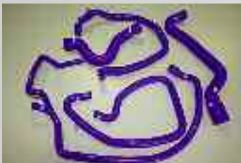
Renault 5 GT TURBO PHASE 1 VE1090472 1985 > 1986 Tipo di Tubo: Coolant Numero di Tubi: 5 euro 426,60