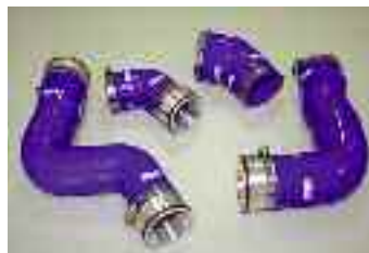
Audi A3 2.0 TFSI VE1081595 2004 > Present Tipo di Tubo: Turbo Numero di Tubi: 4 euro 408,00