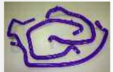
Renault 5 GT TURBO PHASE 1 VE1090640 1985 > 1986 Tipo di Tubo: Ancillary Numero di Tubi: 3 euro 253,50