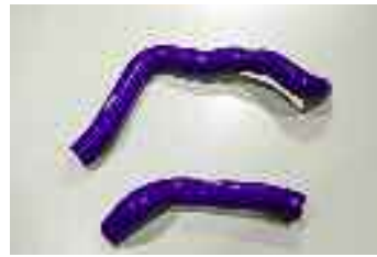
Seat CORDOBA 1.4 16V VE1040608 1999 - 2005 Tipo di Tubo: Coolant Numero di Tubi: 2 euro 102,80