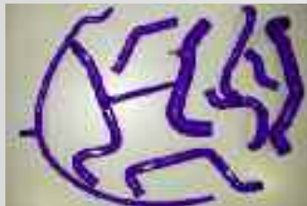
Volkswagen GOLF MK3 VR6 2.8 VE1040555 1991 > 1995 Tipo di Tubo: Coolant Numero di Tubi: 8 euro 351,10