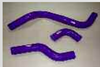
Hyundai COUPE 1.6 FX VE1050514 1996 > 2001 Tipo di Tubo: Coolant Numero di Tubi: 3 euro 125,70