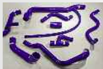
Volkswagen CORRADO G60 VE1040635 1988 > 1993 Tipo di Tubo: Coolant Numero di Tubi: 8 euro 303,42