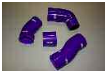
Audi TT 225 VE1060780 1998 > 2006 Tipo di Tubo: Turbo Numero di Tubi: 4 euro 185,60