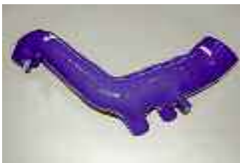
Audi TT 180 VE1060038 1998 > 2006 Tipo di Tubo: Induction Numero di Tubi: 1 euro 194,10