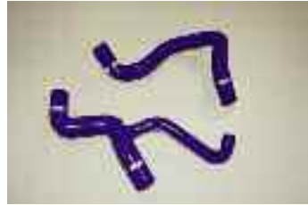
Ford FOCUS ST/SVT 170 VE1071663 2002 > 2004 Tipo di Tubo: Coolant Numero di Tubi: 2 euro 164,70