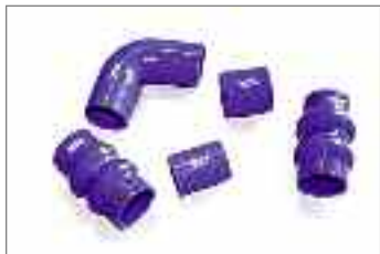
Ford GALAXY 1.8 TDCI VE1080741 2006 > Present Tipo di Tubo: Turbo Numero di Tubi: 5 euro 172,00