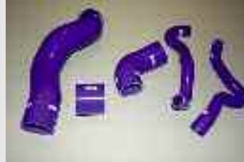
Volkswagen NEW BEETLE 1.8T 20V VE1060657 1999 > 2001 Tipo di Tubo: Turbo Numero di Tubi: 5 euro 211,40