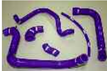
Porsche 924 2.0i VE1100854 1976 > 1985 Tipo di Tubo: Coolant Numero di Tubi: 6 euro 293,60