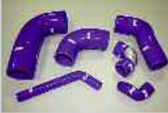
Volkswagen GOLF MK2 G60 RALLYE VE1091390 1988 > 1989 Tipo di Tubo: S'charger Numero di Tubi: 6 euro 357,80