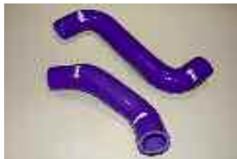
Subaru IMPREZA 2.0 WRX VE1050915 2000 > 2007 Tipo di Tubo: Coolant Numero di Tubi: 2 euro 122,80