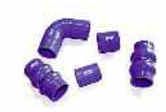
Ford C-MAX 1.8 TDCI VE1080741 2003 > Present Tipo di Tubo: Turbo Numero di Tubi: 5 euro 172,00