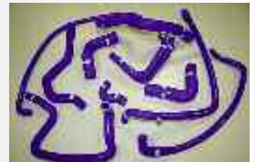
Peugeot 205 GTI 1.6/1.9 VE1100196 1984 > 1993 Tipo di Tubo: Coolant Numero di Tubi: 9 euro 297,60