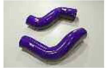
Audi TT 225 VE1040172 1998 > 2006 Tipo di Tubo: Intercooler Numero di Tubi: 2 euro 217,80