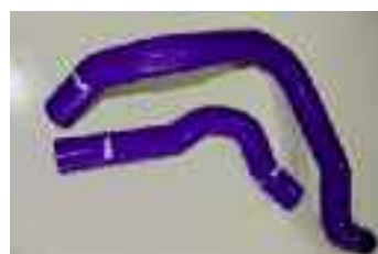
Honda CIVIC 1.6 VTI VE1070616 1996 > 1997 Tipo di Tubo: Coolant Numero di Tubi: 3 euro 122,40