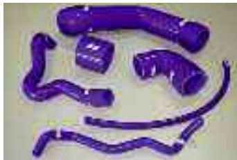
Seat LEON 1 1.8T 20V 180CV VE1100164 1999 > 2005 Tipo di Tubo: Turbo Numero di Tubi: 6 euro 210,00