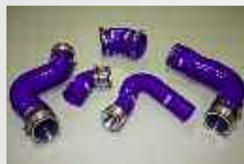
Volkswagen GOLF MK5 2.0 TFSI VE1101129 2004 > 2009 Tipo di Tubo: Turbo Numero di Tubi: 5 euro 456,00