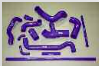
BMW M3 E30 VE1090583 1986 > 1991 Tipo di Tubo: Coolant Numero di Tubi: 13 euro 432,00