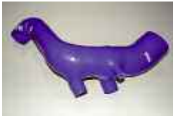
Seat LEON 1 1.8T 20V VE1050017 1996 > 2005 Tipo di Tubo: Induction Numero di Tubi: 1 euro 197,80