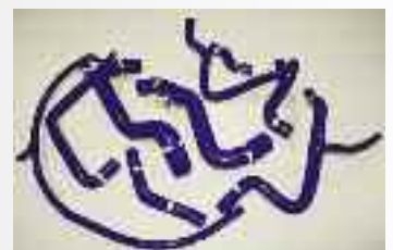
Volkswagen CORRADO VR6 VE1090643 1991 > 1995 Tipo di Tubo: Coolant Numero di Tubi: 8 euro 351,60