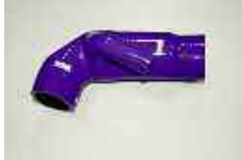
Seat IBIZA GTI 16V VE1081285 1993 > 1996 Tipo di Tubo: Induction Numero di Tubi: 1 euro 119,50