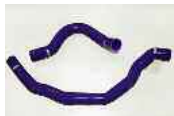
Volvo S60 2.4L TURBO VE1081139 2001 > Present Tipo di Tubo: Coolant Numero di Tubi: 2 euro 111,60