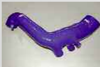
Skoda OCTAVIA 1.8T 20V VE1060038 1996 > Present Tipo di Tubo: Induction Numero di Tubi: 1 euro 194,10