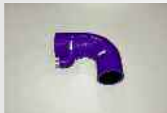
Citroën SAXO MK1 VTS VE1031265 1996 > 2003 Tipo di Tubo: Induction Numero di Tubi: 1 euro 115,10