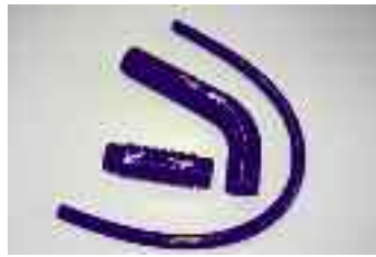
Seat 600 DE L ESPECIAL VE1070659 - Tipo di Tubo: Coolant Numero di Tubi: 3 euro 120,00