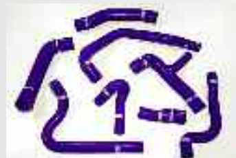
Volkswagen GOLF MK2 GTI 1.8 16V VE1031153 1986 > 1992 Tipo di Tubo: Coolant Numero di Tubi: 7 euro 206,40