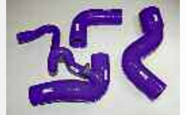
Volkswagen PASSAT 1.8TURBO TYPE 3B VE1040457 1997 > 2000 Tipo di Tubo: Turbo Numero di Tubi: 4 euro 215,80