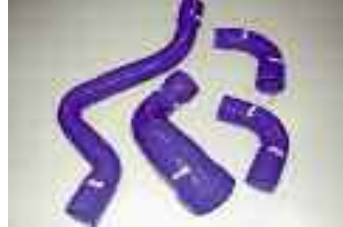
Opel VECTRA A/CAVALIERT 16V TURBO VE1040516 1992 > 1995 Tipo di Tubo: Turbo Numero di Tubi: 4 euro 266,00