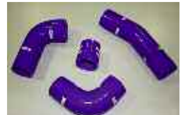
Volvo S/V70 TURBO/T5 VE1081111 1998 > 2000 Tipo di Tubo: Turbo Numero di Tubi: 4 euro 146,52