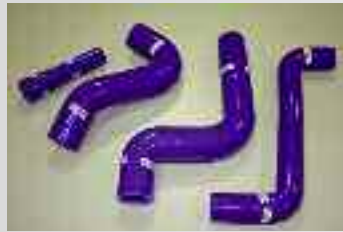
Volkswagen GOLF MK1 GTI VE1091335 1976 > 1983 Tipo di Tubo: Coolant Numero di Tubi: 4 euro 128,40