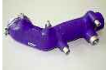
Subaru IMPREZA 2.0 WRX/GT VE1090238 1997 > 1998 Tipo di Tubo: Induction Numero di Tubi: 1 euro 283,20