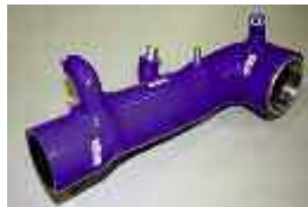
Subaru IMPREZA 2.0 WRX VE1050936 2000 > 2007 Tipo di Tubo: Induction Numero di Tubi: 1 euro 351,60