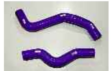
Mitsubishi LANCER EVO 6 VE1031100 1999 > 2000 Tipo di Tubo: Coolant Numero di Tubi: 2 euro 113,80