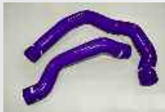
Alfa Romeo GT 1.9 JTD VE1080824 2004 > Present Tipo di Tubo: Turbo Numero di Tubi: 2 euro 210,00