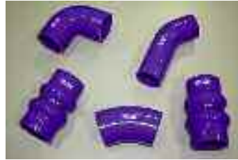
Ford MONDEO 1.8 TDCI VE1081203 1998 > 2000 Tipo di Tubo: Turbo Numero di Tubi: 5 euro 172,00