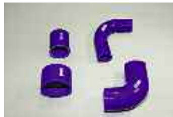
Subaru IMPREZA 2.0 STI VE1031177 1997 > 1998 Tipo di Tubo: Turbo Numero di Tubi: 4 euro 79,10