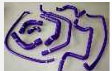
Peugeot 309 GTI 1.6/1.9 LHD VE1100146 1987 > 1992 Tipo di Tubo: Coolant Numero di Tubi: 9 euro 270,50