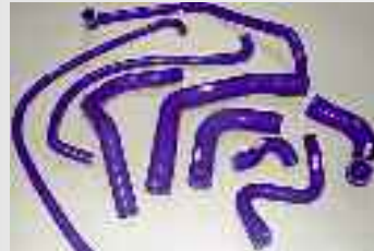
Peugeot 205 GTI 1.6/1.9 RHD VE1050332 1984 > 1993 Tipo di Tubo: Coolant Numero di Tubi: 9 euro 270,50