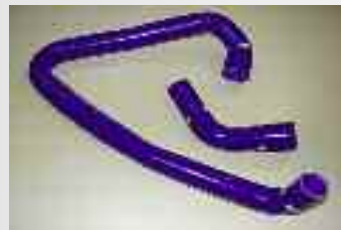
Nissan 300 ZX VE1060377 1983 > 1989 Tipo di Tubo: Coolant Numero di Tubi: 2 euro 221,00