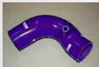
Mini COOPER S VE1060638 2001 > 2006 Tipo di Tubo: Induction Numero di Tubi: 1 euro 87,40