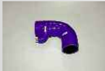
Peugeot 106 XSI VE1031265 1995 > 1999 Tipo di Tubo: Induction Numero di Tubi: 1 euro 115,10