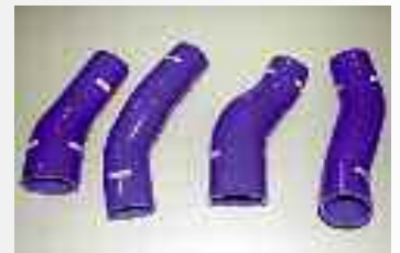
Nissan 300 ZX BITURBO VE1060319 1989 > 2000 Tipo di Tubo: Turbo Numero di Tubi: 4 euro 179,20