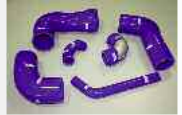
Volkswagen GOLF MK2 G60 RALLYE VE1090954 1989 > 1991 Tipo di Tubo: S'charger Numero di Tubi: 6 euro 369,10