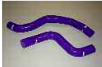
Mitsubishi LANCER EVO 8 VE1060471 2003 > 2005 Tipo di Tubo: Coolant Numero di Tubi: 2 euro 97,80