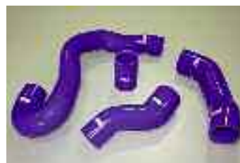
Opel ASTRA H 2.0L OPC/VXR VE1090612 2005 > Present Tipo di Tubo: Turbo Numero di Tubi: 4 euro 225,30