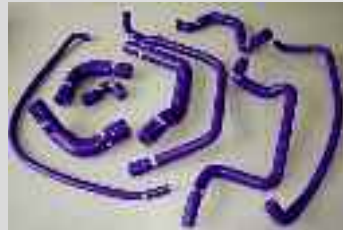
Peugeot 205 GTI 1.6/1.9 LHD VE1100146 1984 > 1993 Tipo di Tubo: Coolant Numero di Tubi: 9 euro 270,50