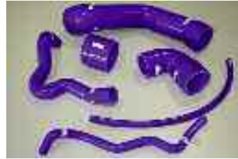
Audi TT 180 VE1100164 1998 > 2006 Tipo di Tubo: Turbo Numero di Tubi: 6 euro 185,60