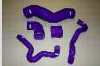
Volkswagen NEW BEETLE 1.8T 20V VE1060742 2001 > Present Tipo di Tubo: Turbo Numero di Tubi: 5 euro 211,00