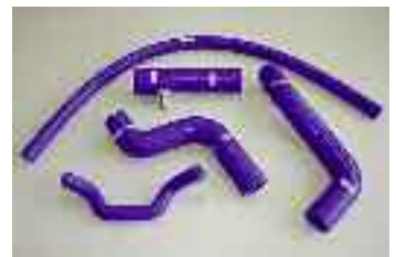
Lancia DELTA INTEGRALE 8V VE1100538 1987 > 1989 Tipo di Tubo: Turbo Numero di Tubi: 5 euro 168,20