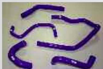
Renault CLIO 1 1.8 16V VE1031161 1991 > 1998 Tipo di Tubo: Ancillary Numero di Tubi: 5 euro 211,20