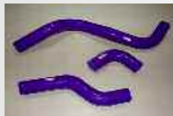
Hyundai LANTRA 1.6 FX VE1050514 1996 > 2000 Tipo di Tubo: Coolant Numero di Tubi: 3 euro 125,70