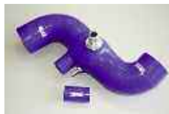
Lancia DELTA INTEGRALE 16V VE1100640 1987 > 1994 Tipo di Tubo: Induction Numero di Tubi: 2 euro 194,90