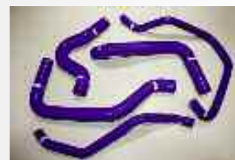
Fiat COUPE 2.0 GT 20V VE1100675 1996 > 2000 Tipo di Tubo: Coolant Numero di Tubi: 5 euro 243,50