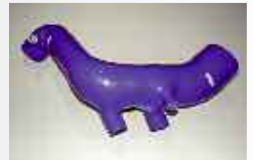
Volkswagen GOLF MK4 1.8T 20V VE1050017 2001 > 2006 Tipo di Tubo: Induction Numero di Tubi: 1 euro 197,80