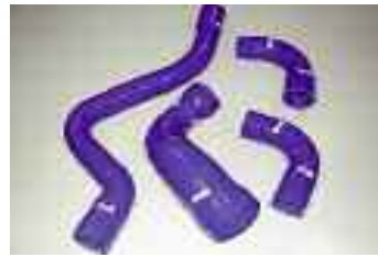
Opel CALIBRA 16V TURBO VE1040516 1992 > 1997 Tipo di Tubo: Turbo Numero di Tubi: 4 euro 266,00