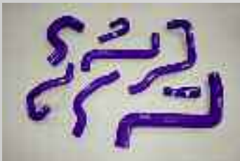
Volkswagen GOLF MK2 GTI 1.8 8V VE1031144 1987 > 1991 Tipo di Tubo: Coolant Numero di Tubi: 8 euro 248,40