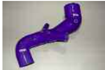
Seat LEON 1 CUPRA-R 1.8T 20V VE1030939 2002 > 2005 Tipo di Tubo: Induction Numero di Tubi: 1 euro 159,10