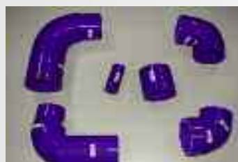
Fiat COUPE 2.0 GT 16V VE1051019 1993 > 2000 Tipo di Tubo: Turbo Numero di Tubi: 6 euro 238,10