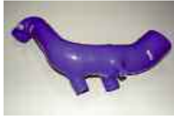
Audi TT 180 VE1050017 1998 > 2006 Tipo di Tubo: Induction Numero di Tubi: 1 euro 197,80