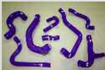
Volkswagen GOLF MK2 GTI 1.8 16V VE1090312 1986 > 1992 Tipo di Tubo: Coolant Numero di Tubi: 7 euro 225,00