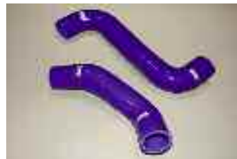
Subaru IMPREZA 2.5 WRX/STI VE1050915 2000 > 2007 Tipo di Tubo: Coolant Numero di Tubi: 2 euro 122,80