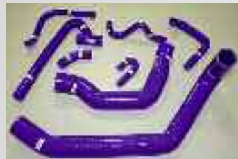
Nissan 200 SX VE1090190 1988 > 1993 Tipo di Tubo: Coolant Numero di Tubi: 9 euro 189,40