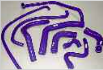
Peugeot 309 GTI 1.6/1.9 RHD VE1050332 1987 > 1992 Tipo di Tubo: Coolant Numero di Tubi: 9 euro 270,50