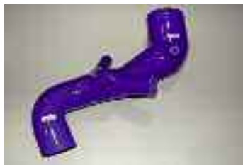
Audi TT 225 VE1030939 1998 > 2006 Tipo di Tubo: Induction Numero di Tubi: 1 euro 159,10