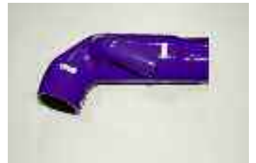
Seat TOLEDO 2.0 GTI 16V VE1081285 1995 > 1998 Tipo di Tubo: Induction Numero di Tubi: 1 euro 210,00