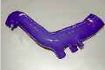
Volkswagen NEW BEETLE 1.8T 20V VE1060038 1999 > 2001 Tipo di Tubo: Induction Numero di Tubi: 1 euro 194,10