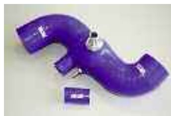
Lancia DELTA INTEGRALE 8V VE1100640 1987 > 1994 Tipo di Tubo: Induction Numero di Tubi: 2 euro 194,90