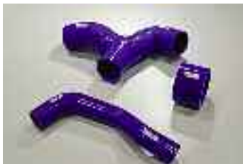
Subaru IMPREZA 2.0 WRX VE1040584 2000 > 2005 Tipo di Tubo: Turbo Numero di Tubi: 3 euro 128,40