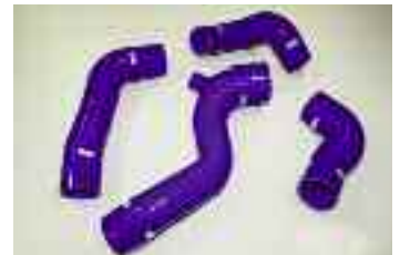
Audi A4 B7 2.0 TURBO VE1081164 2005 > 2007 Tipo di Tubo: Intercooler Numero di Tubi: 4 euro 245,30