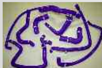
Peugeot 309 GTI 1.6/1.9 VE1100196 1987 > 1992 Tipo di Tubo: Coolant Numero di Tubi: 9 euro 297,60