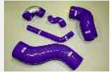
Volkswagen GOLF MK2 G60 VE1081394 1988 > 1991 Tipo di Tubo: S'charger Numero di Tubi: 5 euro 326,30