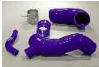
Mitsubishi LANCER EVO 4/5/6 VE1031172 1996 > 2000 Tipo di Tubo: Induction Numero di Tubi: 4 euro 388,10