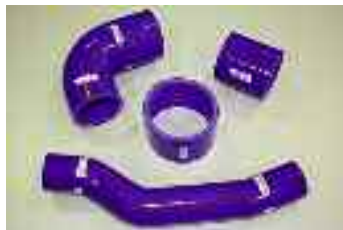
Subaru IMPREZA STI VE1090895 2000 > 2007 Tipo di Tubo: Turbo Numero di Tubi: 4 euro 90,50