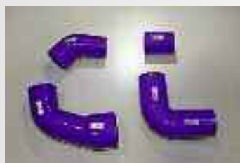
Fiat UNO MK1 TURBO 1.3 VE1040464 1985 > 1989 Tipo di Tubo: Turbo Numero di Tubi: 4 euro 110,50