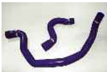
Volvo S/V70 TURBO/T5 VE1081136 1998 > 2000 Tipo di Tubo: Coolant Numero di Tubi: 2 euro 110,80