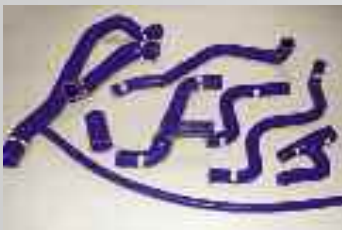
Volkswagen GOLF MK2 G60 RALLYE VE1090767 1989 > 1991 Tipo di Tubo: Coolant Numero di Tubi: 8 euro 305,10