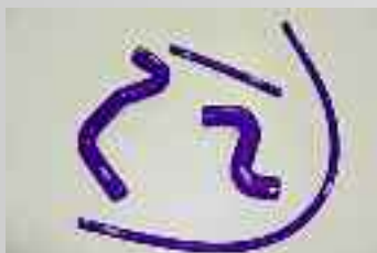
Peugeot 206 XS 1.4/1.6 VE1031138 1998 > 2008 Tipo di Tubo: Coolant Numero di Tubi: 4 euro 143,20