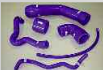
Volkswagen GOLF MK4 1.8T 20V VE1100164 2001 > 2004 Tipo di Tubo: Turbo Numero di Tubi: 6 euro 210,00