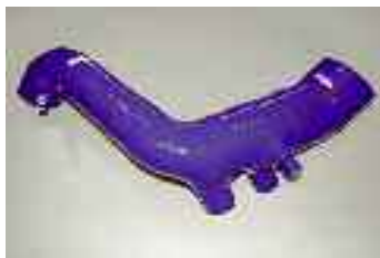
Audi A3 1.8T 20V VE1060038 1996 > 2003 Tipo di Tubo: Induction Numero di Tubi: 1 euro 194,10