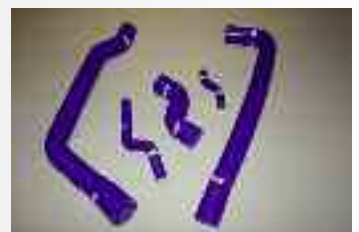
Mini COOPER VE1060578 2001 > 2006 Tipo di Tubo: Coolant Numero di Tubi: 5 euro 171,00