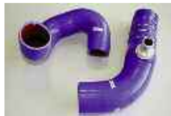
Lancia DELTA INTEGRALE 8V VE1100628 1987 > 1989 Tipo di Tubo: Turbo Numero di Tubi: 2 euro 160,20