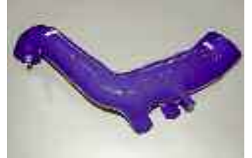
Seat LEON 1 1.8T 20V VE1060038 1996 > 2003 Tipo di Tubo: Induction Numero di Tubi: 1 euro 194,10