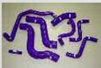
Fiat COUPE 2.0 GT 16V VE1100636 1993 > 2000 Tipo di Tubo: Coolant Numero di Tubi: 8 euro 255,70