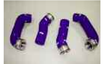
Porsche 997 TURBO VE1080967 2006 > Present Tipo di Tubo: Turbo Numero di Tubi: 4 euro 559,20