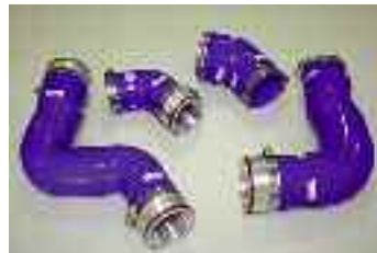
Seat LEON 2 2.0 TFSI VE1081595 2004 > Present Tipo di Tubo: Turbo Numero di Tubi: 4 euro 408,00