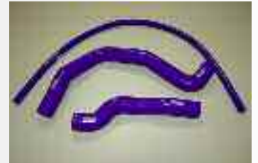
Peugeot 206 GTI VE1031094 1999 > Present Tipo di Tubo: Coolant Numero di Tubi: 3 euro 131,50