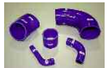
Opel ASTRA H 2.0L OPC/VXR VE1090568 2005 > Present Tipo di Tubo: Induction Numero di Tubi: 5 euro 219,70