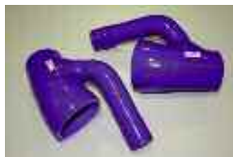
Audi RS4 B5 TYPE 8D VE1101111 1999 > 2001 Tipo di Tubo: Induction Numero di Tubi: 2 euro 232,60