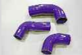
Volkswagen GOLF MK2 G60 RALLYE VE1040655 1988 > 1989 Tipo di Tubo: S'charger Numero di Tubi: 3 euro 287,80