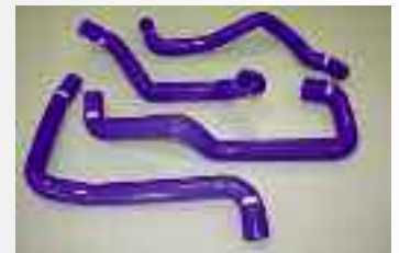
Renault 5 TURBO R8220 VE1090507 1980 > 1984 Tipo di Tubo: Coolant Numero di Tubi: 4 euro 293,30