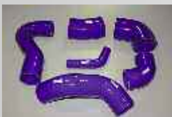
Fiat COUPE 2.0 GT 20V VE1040492 1996 > 2000 Tipo di Tubo: Turbo Numero di Tubi: 6 euro 226,80