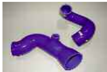
Lancia DELTA INTEGRALE 16V VE1031194 1989 > 1994 Tipo di Tubo: Turbo Numero di Tubi: 2 euro 144,70