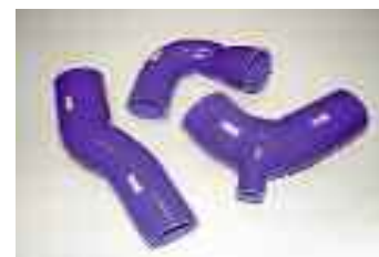
Ford ESCORT COSWORTH YBT92 VE1031107 1992 > 1994 Tipo di Tubo: Turbo Numero di Tubi: 3 euro 175,00