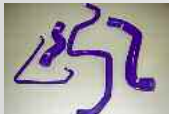
Nissan 350 Z VE1060159 2002 > Present Tipo di Tubo: Coolant Numero di Tubi: 4 euro 146,60