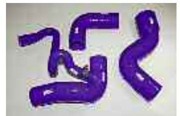
Audi A4 B5 1.8 TURBO VE1040457 1995 > 2001 Tipo di Tubo: Turbo Numero di Tubi: 4 euro 215,80