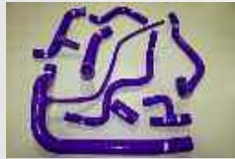
Volkswagen GOLF MK2 G60 VE1081553 1988 > 1991 Tipo di Tubo: Coolant Numero di Tubi: 8 euro 301,00