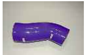
Subaru LEGACY VE1050900 - Tipo di Tubo: Airbox hose Numero di Tubi: 1 euro 85,30