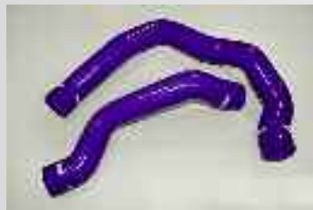
Alfa Romeo 147 1.9 JTD VE1080824 2000 > Present Tipo di Tubo: Turbo Numero di Tubi: 2 euro 210,00