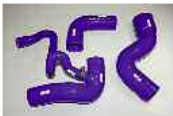
Audi A6 TYPE AB 1.8 TURBO VE1040457 1995 > 2001 Tipo di Tubo: Turbo Numero di Tubi: 4 euro 215,80