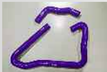
Citroën SAXO MK1 VTR VE1031097 1996 > 2003 Tipo di Tubo: Coolant Numero di Tubi: 2 euro 126,40