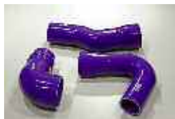
Ford ESCORT COSWORTH YBP94 VE1031116 1994 > 1996 Tipo di Tubo: Turbo Numero di Tubi: 3 euro 175,00