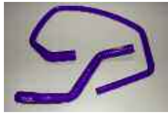
Ford ESCORT COSWORTH YBT92 VE1031112 1992 > 1994 Tipo di Tubo: Heater Numero di Tubi: 2 euro 88,50