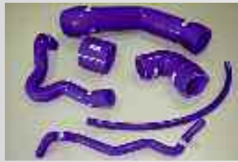
Volkswagen JETTA/BORA MK4 1.8T 20V 180CV VE1100164 2002 > 2005 Tipo di Tubo: Turbo Numero di Tubi: 6 euro 210,00