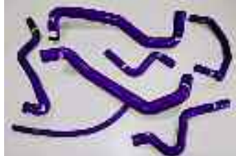
Seat IBIZA GTI 16V VE1040499 1993 > 1996 Tipo di Tubo: Coolant Numero di Tubi: 6 euro 265,20