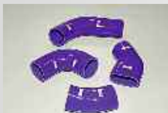
Volkswagen CORRADO G60 VE1040626 1988 > 1993 Tipo di Tubo: S'charger Numero di Tubi: 4 euro 208,90