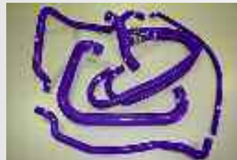
Peugeot 205 1.3L RALLY E VE1091275 1987 > 1992 Tipo di Tubo: Coolant Numero di Tubi: 5 euro 251,40