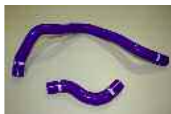
Honda CIVIC 1.5 LSI VE1090019 1991 > 1995 Tipo di Tubo: Coolant Numero di Tubi: 2 euro 117,80