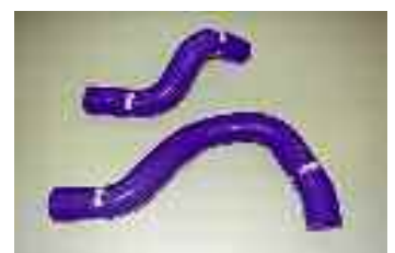
Honda CIVIC TYPE R VE1060192 2001 > 2005 Tipo di Tubo: Coolant Numero di Tubi: 2 euro 101,10