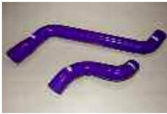
Opel CALIBRA 16V TURBO VE1040526 1992 > 1993 Tipo di Tubo: Coolant Numero di Tubi: 2 euro 105,20