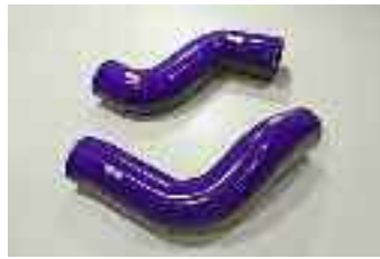
Audi S3 210/225 VE1040172 1999 > 2003 Tipo di Tubo: Intercooler Numero di Tubi: 2 euro 217,80