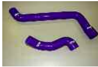
Opel CALIBRA 16V TURBO VE1040539 1993 > 1997 Tipo di Tubo: Coolant Numero di Tubi: 2 euro 104,30