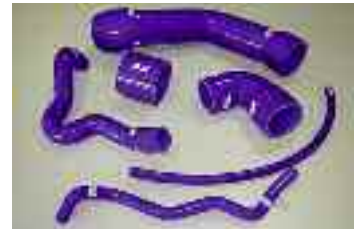
Audi A3 1.8T 20V 180CV VE1100164 1996 > 2003 Tipo di Tubo: Turbo Numero di Tubi: 6 euro 210,00