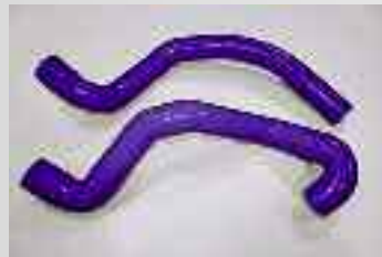
Jeep CHEROKEE XJ 2.5 TD VE1041109 1994 > 2001 Tipo di Tubo: Intercooler Numero di Tubi: 2 euro 324,00