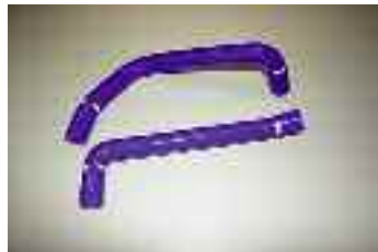
Ford SIERRA COSWORTH 4WD VE1060958 1986 > 1993 Tipo di Tubo: Coolant Numero di Tubi: 2 euro 96,80