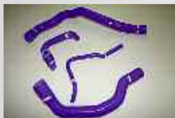
Mini COOPER S VE1060407 2001 > 2006 Tipo di Tubo: Coolant Numero di Tubi: 4 euro 186,90