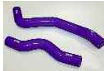
Mitsubishi LANCER EVO 4/5 VE1031103 1996 > 1998 Tipo di Tubo: Coolant Numero di Tubi: 2 euro 101,80