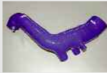
Volkswagen JETTA/BORA MK4 1.8T 20V VE1060038 2000 > 2005 Tipo di Tubo: Induction Numero di Tubi: 1 euro 194,10