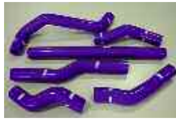
Honda NSX V6 3.0L 273BHP VE1081475 1990 > 1997 Tipo di Tubo: Coolant Numero di Tubi: 6 euro 301,50