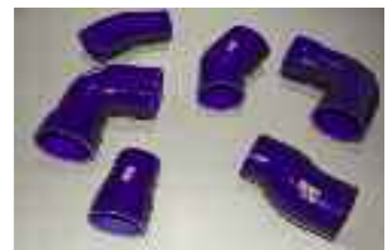
Audi RS6 C5 TYPE 4B VE1040176 2002 > 2004 Tipo di Tubo: Turbo Numero di Tubi: 6 euro 252,66