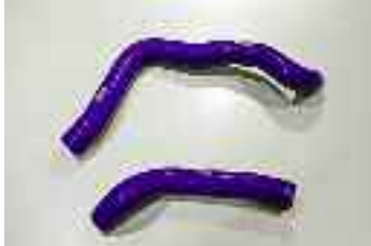
Seat IBIZA 1.4 16V VE1040608 1999 - 2005 Tipo di Tubo: Coolant Numero di Tubi: 2 euro 102,80