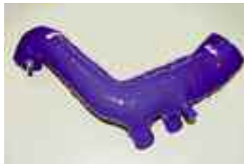
Seat LEON 1 1.8T 20V VE1060038 1999 > 2005 Tipo di Tubo: Induction Numero di Tubi: 1 euro 194,00