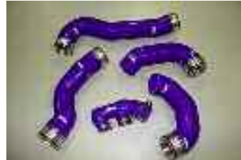
Porsche 996 TURBO S/TT/X50/GT2 VE1080352 2000 > 2005 Tipo di Tubo: Turbo Numero di Tubi: 5 euro 619,80