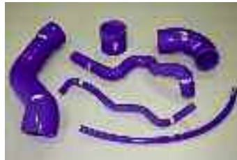
Audi A3 1.8T 20V 150CV VE1100095 1996 > 2003 Tipo di Tubo: Turbo Numero di Tubi: 6 euro 210,00