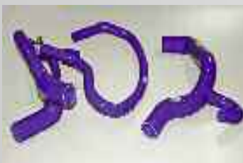
Renault CLIO 1 1.8 16V VE1030936 1991 > 1998 Tipo di Tubo: Coolant Numero di Tubi: 2 euro 235,20