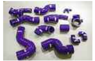
Audi S4 BITURBO 265CV VE1040184 1997 > 2001 Tipo di Tubo: Turbo Numero di Tubi: 12 euro 461,90