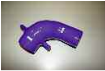
Honda CIVIC TYPE R VE1060318 2001 > 2005 Tipo di Tubo: Induction Numero di Tubi: 1 euro 114,80