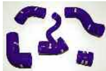
Volvo 850 TURBO/T5 VE1081144 1994 > 1997 Tipo di Tubo: Turbo Numero di Tubi: 5 euro 193,70