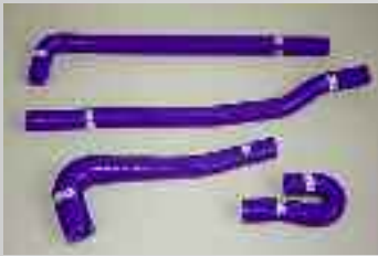
Volkswagen GOLF MK1 1.6/1.8 VE1031121 1974 > 1983 Tipo di Tubo: Ancillary Numero di Tubi: 5 euro 125,90