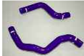
Mitsubishi LANCER EVO 9 VE1080826 2006 > 2007 Tipo di Tubo: Coolant Numero di Tubi: 2 euro 101,60