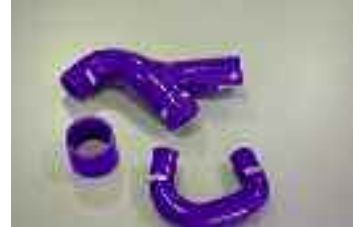
Subaru IMPREZA 2.0 WRX/GT VE1050890 1999 > 2000 Tipo di Tubo: Turbo Numero di Tubi: 3 euro 117,10