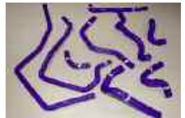
Subaru IMPREZA 2.0 WRX VE1050955 2001 > 2002 Tipo di Tubo: Ancillary Numero di Tubi: 9 euro 149,60