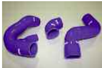
Audi A4 B7 1.8 TURBO VE1080188 2005 > 2008 Tipo di Tubo: Turbo Numero di Tubi: 3 euro 228,00