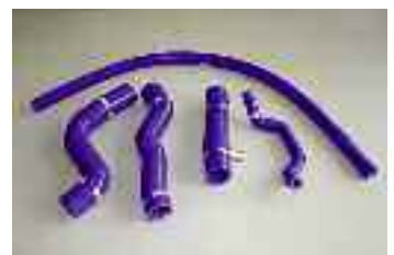
Lancia DELTA INTEGRALE 16V VE1031169 1989 > 1994 Tipo di Tubo: Coolant Numero di Tubi: 5 euro 166,30