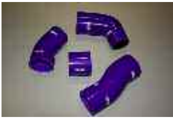
Audi S3 210/225 VE1060780 1999 > 2003 Tipo di Tubo: Turbo Numero di Tubi: 4 euro 185,60