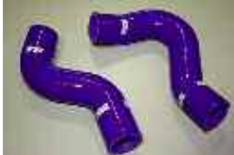
Subaru IMPREZA 2.0 WRX/GT VE1090059 1993 > 1998 Tipo di Tubo: Coolant Numero di Tubi: 2 euro 112,00