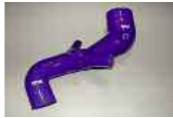
Audi S3 210/225 VE1030939 1999 > 2003 Tipo di Tubo: Induction Numero di Tubi: 1 euro 159,10