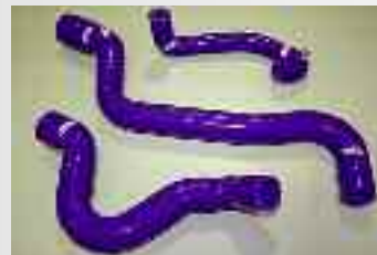
Renault 5 GT TURBO PHASE 2 VE1040588 1987 > 1991 Tipo di Tubo: Coolant Numero di Tubi: 3 euro 240,20