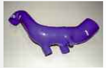
Volkswagen NEW BEETLE 1.8T 20V VE1050017 2001 > Present Tipo di Tubo: Induction Numero di Tubi: 1 euro 197,80