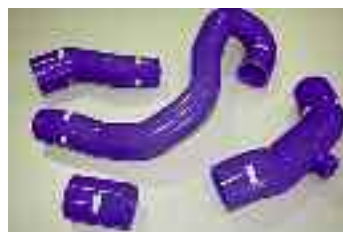
Opel ASTRA H 2.0L OPC/VXR Va VE1090617 2005 > Present Tipo di Tubo: Turbo Numero di Tubi: 4 euro 235,80