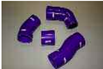
Seat LEON 1 CUPRA-R 1.8T 20V VE1060780 2002 > 2005 Tipo di Tubo: Turbo Numero di Tubi: 4 euro 185,60