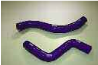
Mitsubishi LANCER EVO 7 VE1031090 2001 > 2002 Tipo di Tubo: Coolant Numero di Tubi: 2 euro 94,80